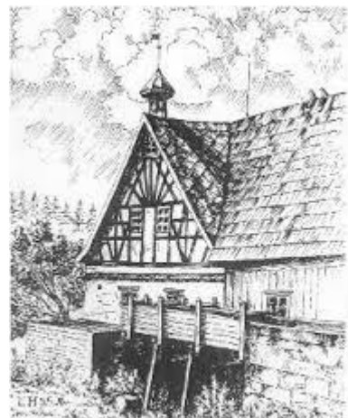
Starý dnes již zaniklý mlýn v Sekerských Chalupách